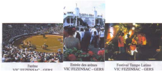
Série indivisible, vues différentes. Pentecôte à Vic l'arène, l'entrée des arènes, festival Tempo Latino.

Timbre : Euro. Référence : Sans Edition : Tirage :