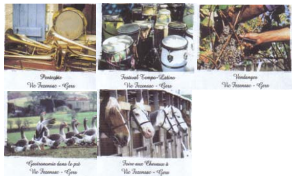
Vic Fezensac. Gers. Pentecôte, festival Tempo Latino, Vendanges, Gastronomie dans le pré, Foire aux chevaux.

Timbre : Vignette d'affranchissement bleue France 20 g. Référence : 809-B2K/0501092, B2K/0309136. Edition : 2004. Tirage :