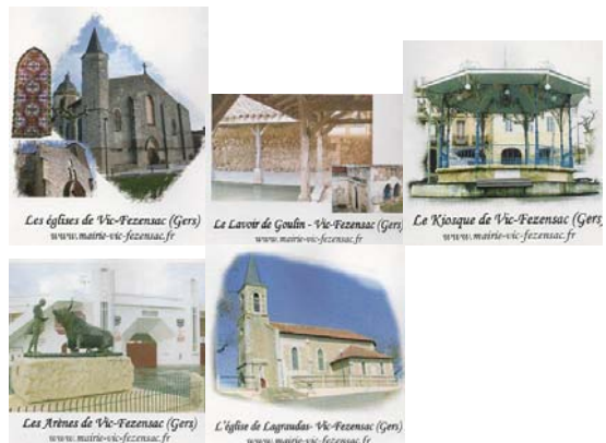
Les églises de Vic-Fezensac (Gers) www.mairie-vic-fezensac.fr Le Lavoir de Goulès - Vic-Fezensac (Gers) www.mairie-vic-fezensac.fr Le Kiosque de Vic-Fezensac (Gers) www.mairie-vic-fezensac.fr Les Arènes de Vic-Fezensac (Gers) www.mairie-vic-fezensac.fr L'église de Lagrandas - Vic-Fezensac (Gers) www.mairie-vic-fezensac.fr

Timbre : Marianne de Luquet RF. Référence : 809-B2K/0306937, B2K/0308343, B2J/0400842. Edition : 2004. Tirage :